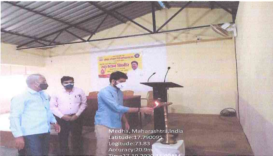
Medha, Maharashtra, India Latitude:17.790095 Longitude:73.83 Accuracy:20.9m Time27-10-2020 11:06AM