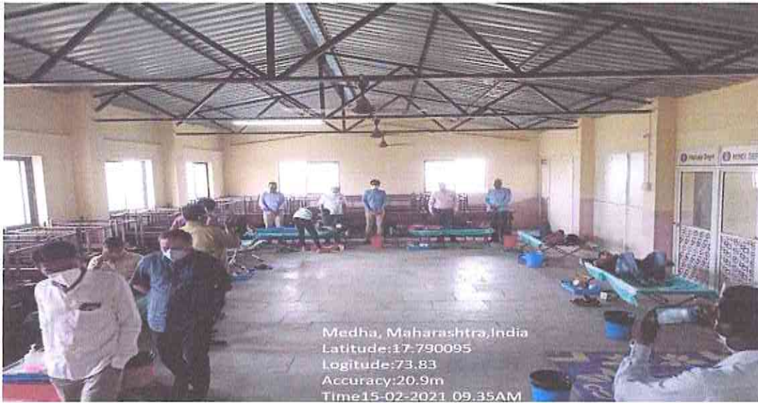
Medha, Maharashtra, India Latitude:17.790095 Longitude:73.83 Accuracy:20.9m Time15-02-2021 09.35AM