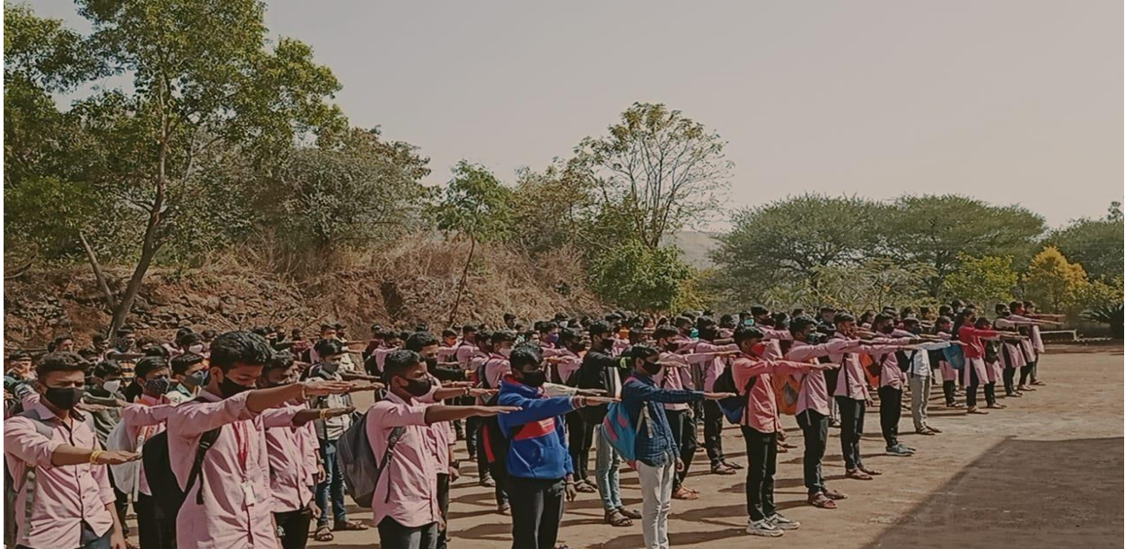
मतदार जागृती निमित्त प्रतिज्ञा घेताना स्वयंसेवक