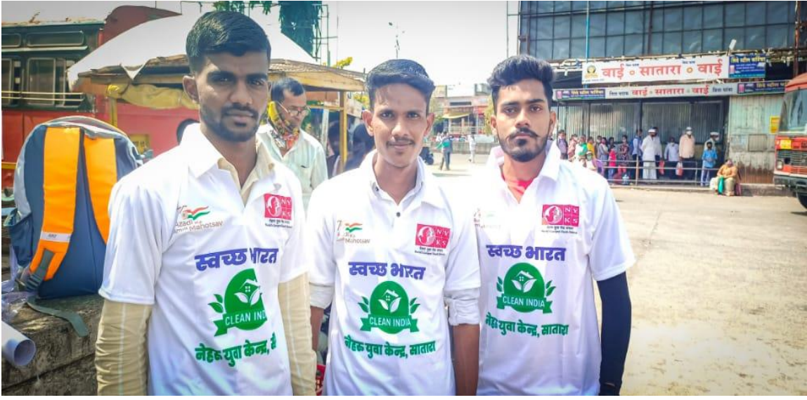
स्वच्छभारत अभियानात सहभागी स्वयंसेवक