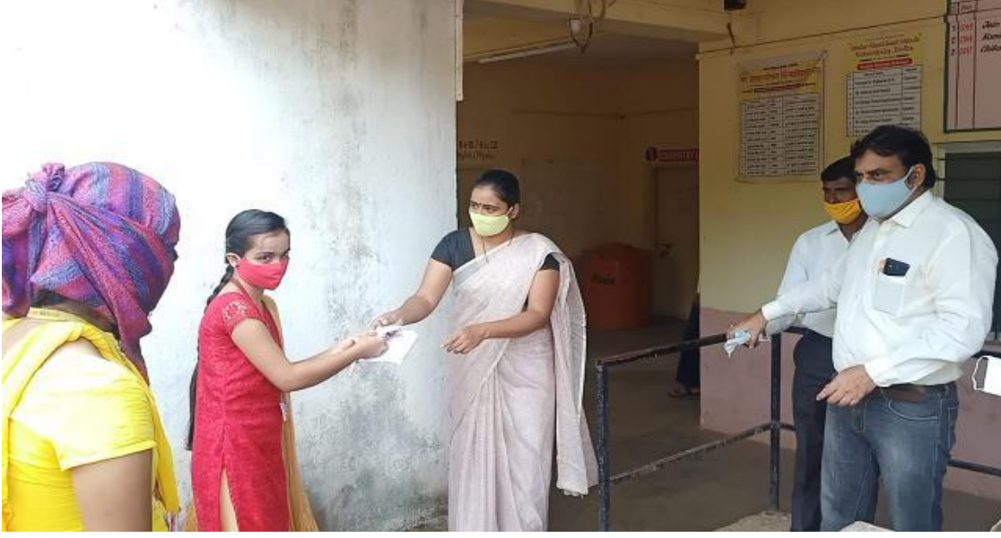
महाविद्यालयात विद्यापीठ परीक्षेदरम्यान मास्क व स्यानीटायजर वाटप करताना